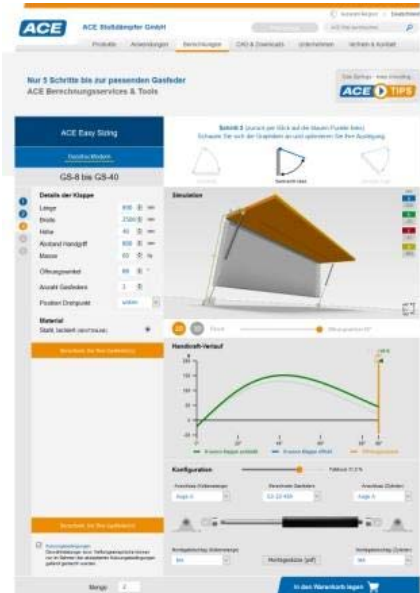
Bild 3 ACE Smart-Sizing Gasfeder komplett 01.jpg

Unter www.ace-ace.de lassen sich Gasfedern ab sofort in nur einer Minute berechnen, auslegen und bestellen