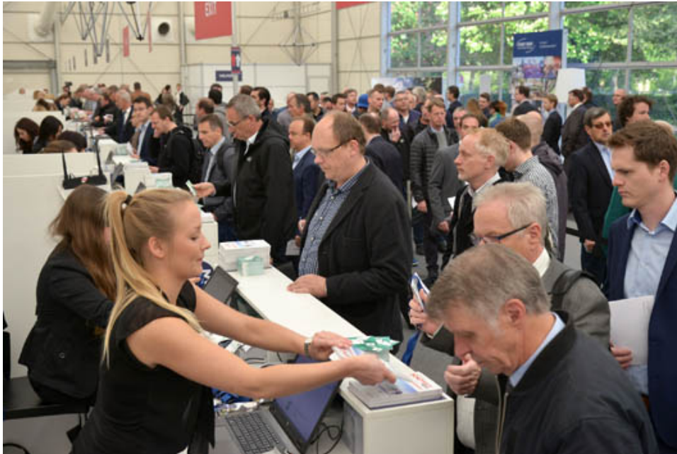
Bild Nr. 24-01 EF_Solids+RT-Eingang.jpg. Am 7. und 8. November öffnet das Fachmessen-Duo Solids & Recycling-Technik Dortmund erneut seine Pforten.