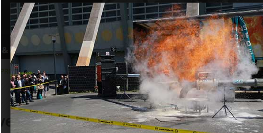
Bild Nr. 25-01 EF_LiveExplosion.jpg.

Live-Explosionen weisen während des Fachmessen-Duos Solids & Recycling-Technik Dortmund auf das wichtige Thema Explosionsschutz hin.