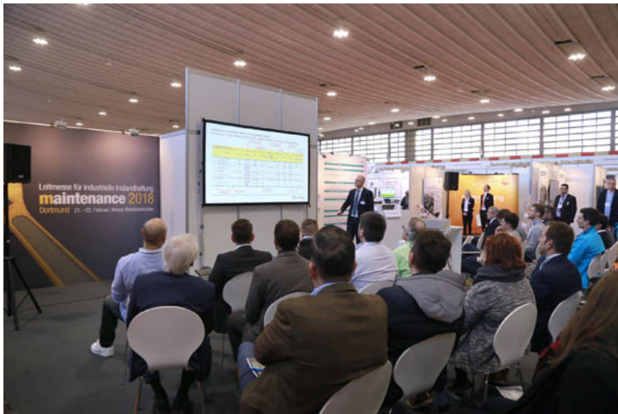
Bild Nr. 26-02 EF_MaintenanceVortrag.jpg.

Jubiläumsmesse: Am 20. und 21. Februar 2019 findet die Fachmesse Maintenance für industrielle Instandhaltung in Dortmund bereits zum 10. Mal statt.