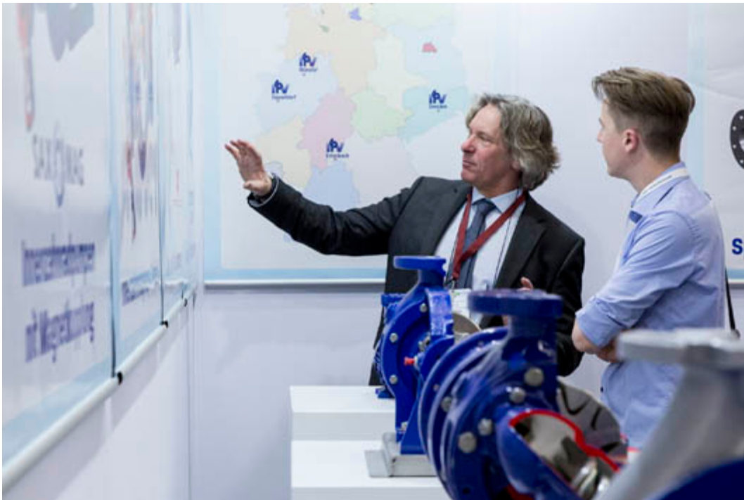
Bild Nr. 31-03 EF_MainPV-Standgespräch.jpg.

Über 5000 Fachbesucher nutzten die Gelegenheiten, sich über die Neuheiten zu informieren.