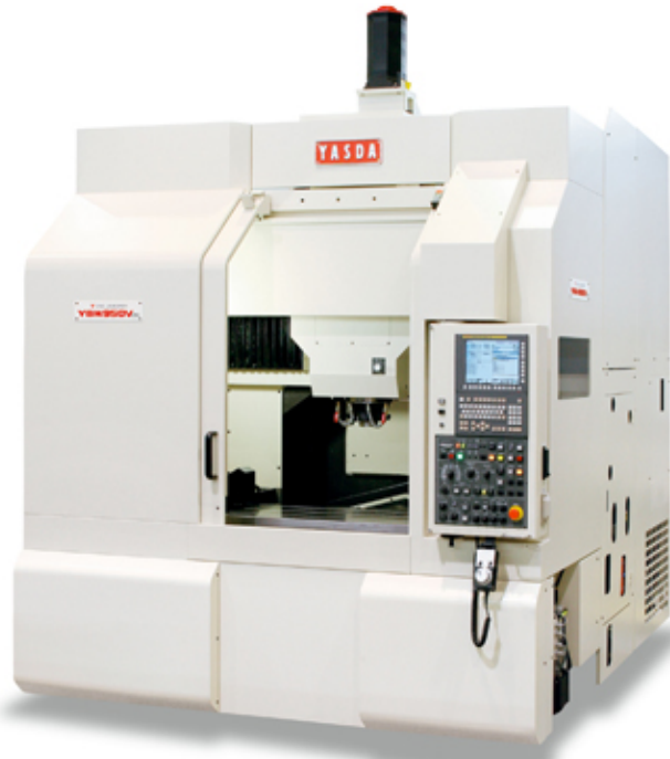
Bild Nr. 23-01 TT_YS-YBM950V.jpg.

Die 3-Achs Fräsmaschine YASDA YBM 950V arbeitet mitprozesssicherer Präzision und der Qualität eines Lehrenbohrwerks.