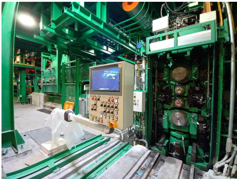
Blick auf das Inline-Dressierwalzwerk.