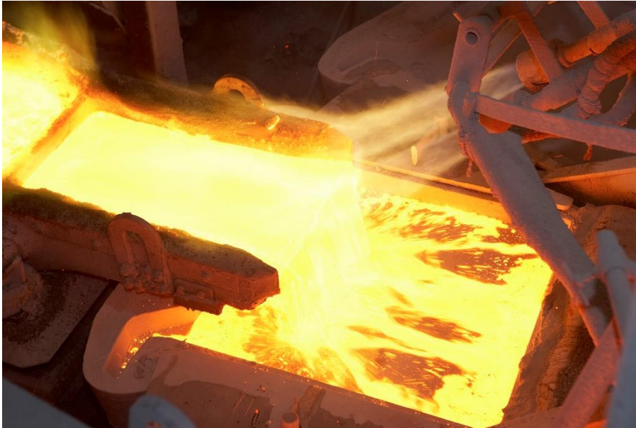
Gießen von Anoden.