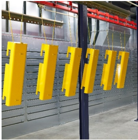
Bild Nr. 13-04 KY_LT4U-Pulverbeschichtung.jpg

Die neue, hochleistungsfähige Pulverbeschichtungsanlage ermöglicht das gesamte denkbare Farbspektrum.