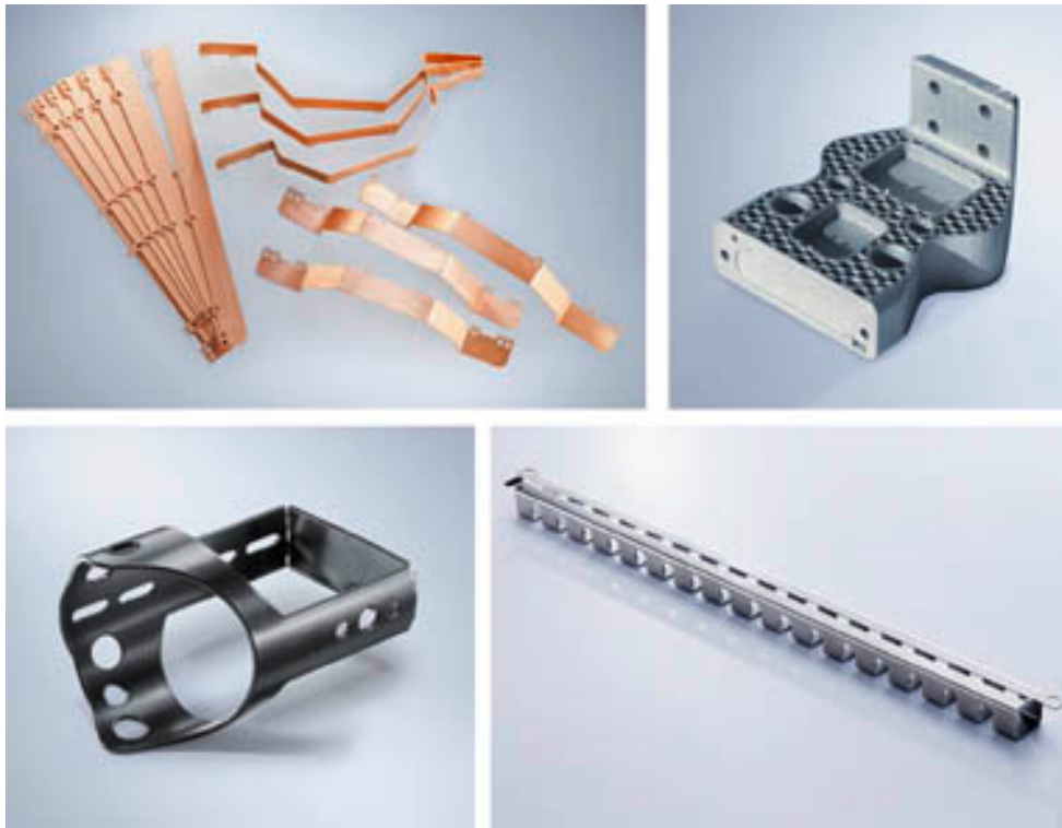
Bild Nr. 13-02 KY_LT4U-Produktvielfalt2.jpg

Gewerbliche Kunden haben nun in Österreich über die Beschaffungsplattform Laserteile4you.at die gleichen vielfältigen Möglichkeiten bei der Online-Blechteilebestellung wie in Deutschland.