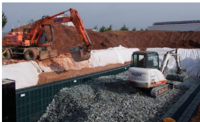
Der Schotter Speicher wird befüllt

Gerade meinen Frühstücksrundflug ums Firmengelände beendet. Dabei ist mir aufgefallen, dass meine Leute schon einiges für Nachhaltigkeit tun. Von Berichten der Kollegen weiß ich, dass sich unter unserem Firmengebäude ein großer Schotter Speicher befindet, der mit Hilfe der Natur dafür sorgt, dass wir in den Räumen immer ein gutes Klima haben. Den kann ich im Moment natürlich nicht mehr sehen. Steht ja schließlich das Firmengebäude drauf!