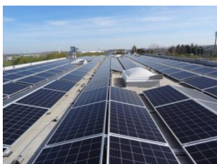
120 kWp auf knapp 1.000m 2

Aber auf dem Dach habe ich unsere Solar-Panels entdeckt. Die sorgen dafür, dass wir einen ganzen Teil unseres benötigten Stroms mit Hilfe der Sonne selber produzieren können.