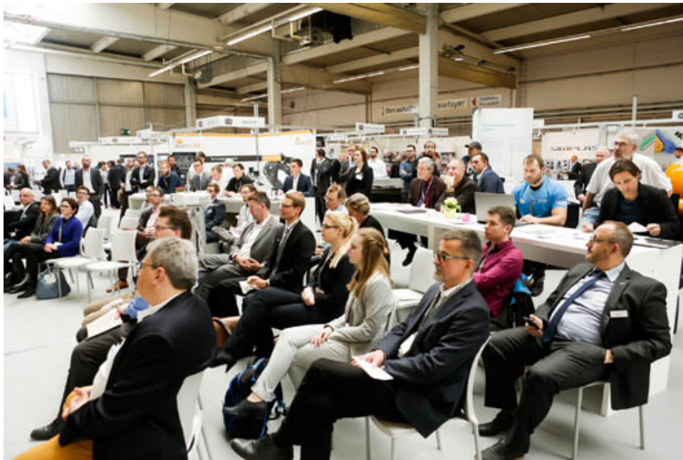
Bild Nr. 54-03 EF_KPA-Zuhoerer.jpg.

Wertvoller Austausch: Die Fachmesse KPA – Kunststoff Produkte Aktuell ist auch wegen ihrer Vorträge ein Publikumsmagnet in der Kunststoffbranche.