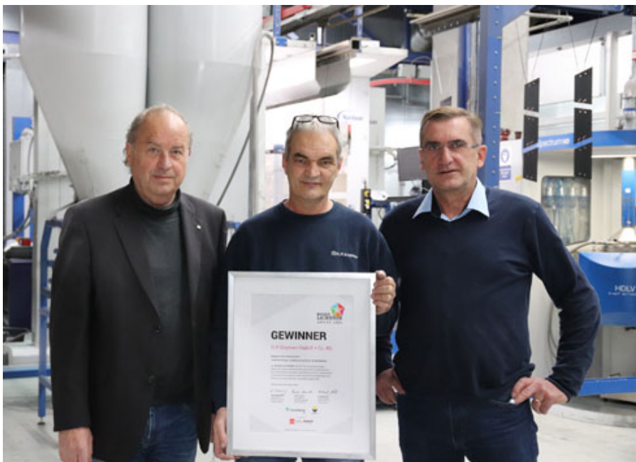
Bild Nr. 14-01 KY_Gewinner.jpg.