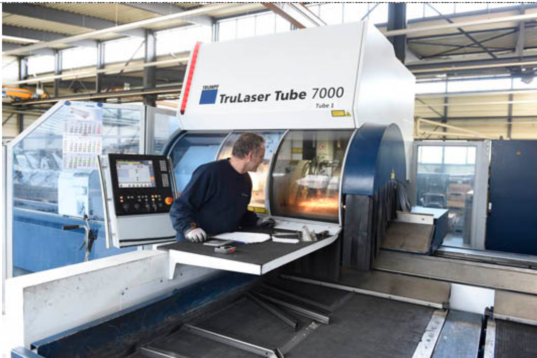
Bild Nr. 15-07 KY_Produktion-TruTube7000.jpg. Auch Rohrlaserbearbeitung gehört zum Fertigungsspektrum von H. P. Kaysser.