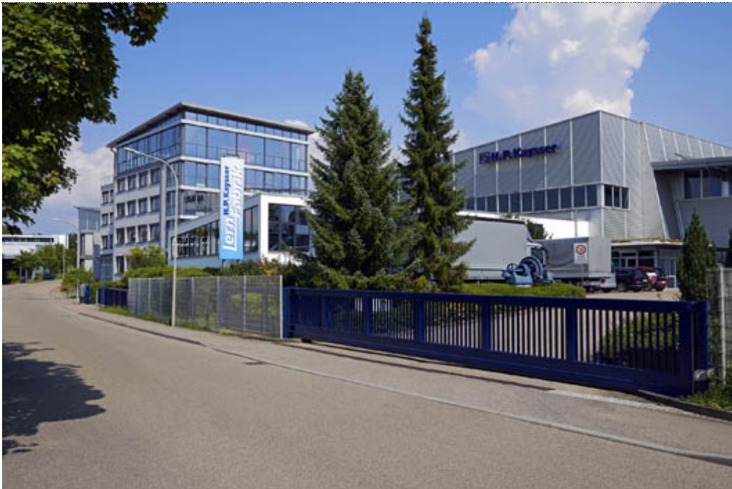
Bild Nr. 15-05 KY_Gelaende.jpg.

Ergebnis von 75 Jahren stetem Wachstums: Regelmäßig erweitertes Firmengelände von H. P. Kaysser.