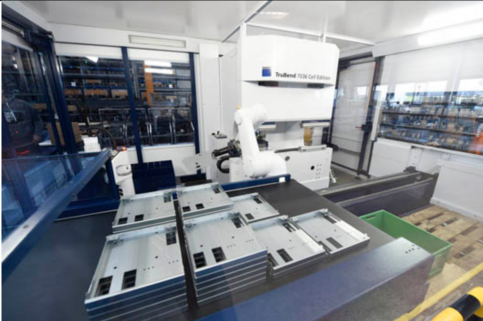
Bild Nr. 15-08 KY_Produktion-TruBend7036.jpg.

Moderne Maschinen und Anlagen ermöglichen H. P. Kaysser die wirtschaftliche und termintreue Fertigung.