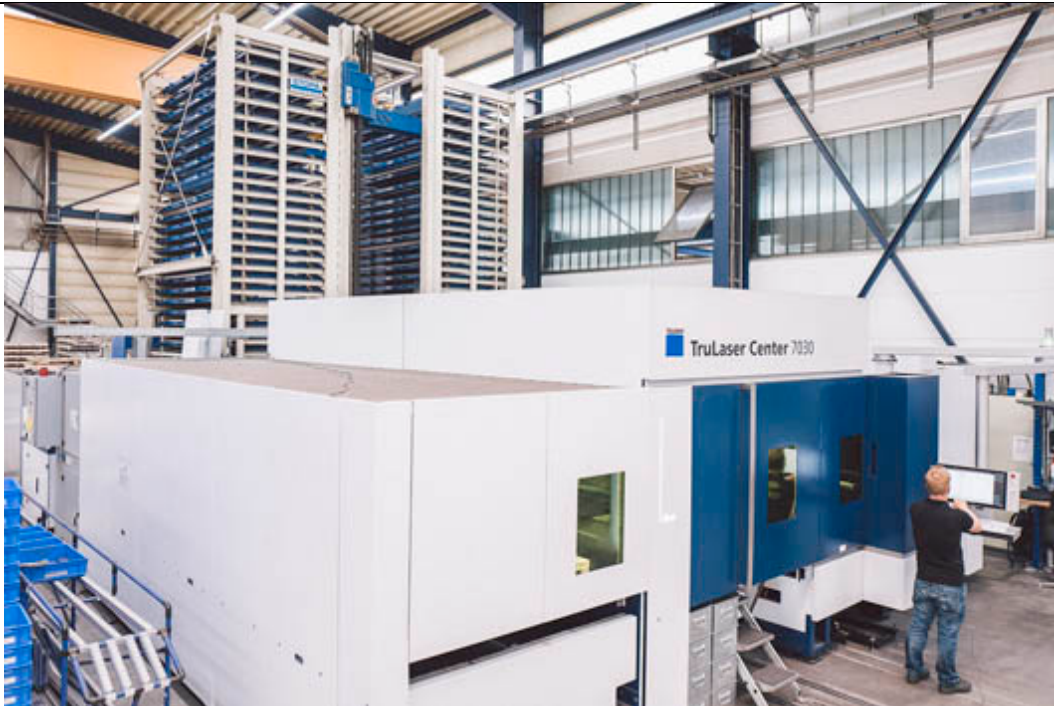
Bild Nr. 15-06 KY_Produktion-TruLaser7030.jpg. Ein grandioser Maschinenpark, verbunden mit großer Fertigungstiefe und namhaftesten Kunden, spiegeln die Leidenschaft von H. P. Kaysser für die Metallbearbeitung wider.