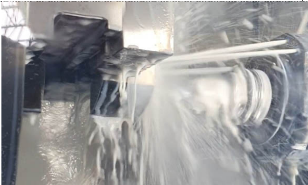
Bild Nr. 28-02 OE_Zerspanung-KSS.jpg.

Kühlschmierstoffhersteller Oemeta hat Nachhaltigkeitsaspekte beim Einsatz von Bearbeitungsmedien für die zerspanende Bearbeitung definiert, eingestuft und berücksichtigt diese.