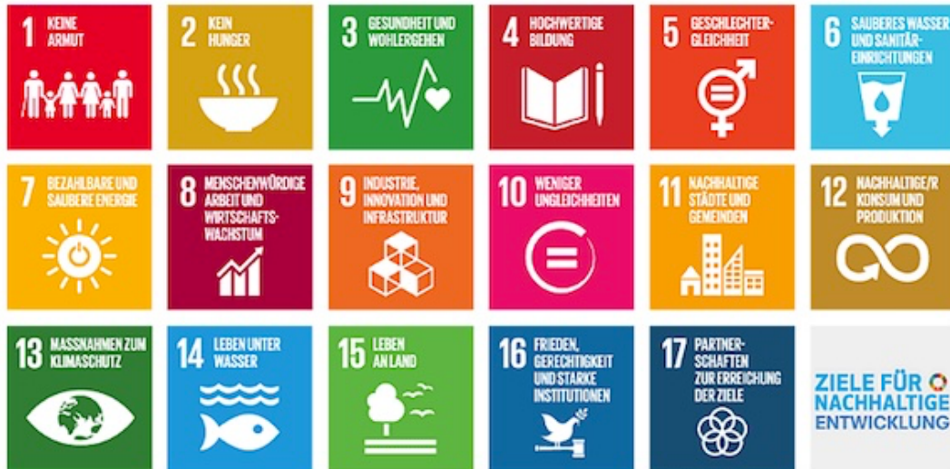
Bild Nr. 28-01 OE_UN-Ziele-SDG.jpg.

2015 wurde die Agenda 2030 durch die Generalversammlung der vereinten Nationen, verabschiedet. Deren Ziel ist es, die weltweite Entwicklung ökologisch, wirtschaftlich und sozial nachhaltig zu gestalten. Herzstück der Agenda sind die 17 Ziele für nachhaltige Entwicklung (Sustainable Development Goals, SDGs).