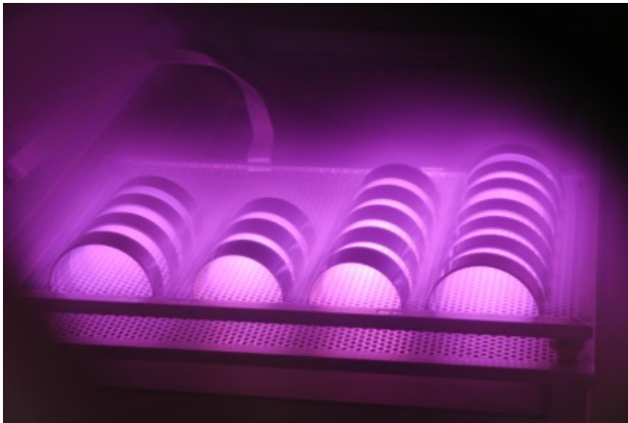
Bild Nr. 19-02 OV_Plasmareinigug.jpg. Erst das Plasmaverfahren schafft LABS-Konformität.